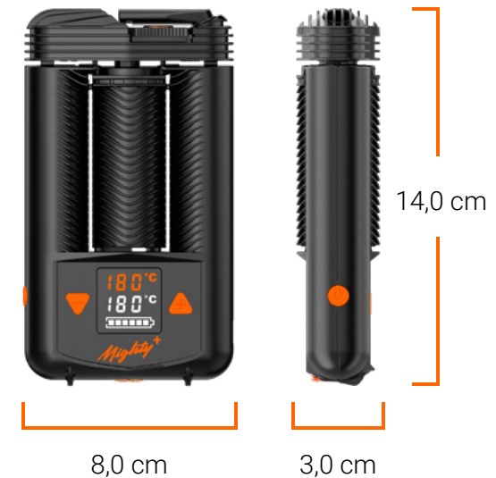
MIGHTY+ MEDIC PPN: 111661680357