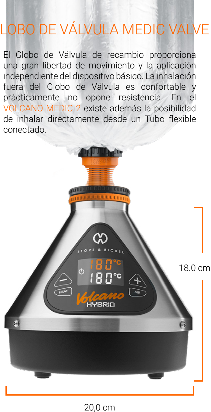
VOLCANO MEDIC 2 PPN: 111588550156

El Vaporizador MIGHTY+ MEDIC se caracteriza por su sencillo manejo. Las dos baterías recargables de alto rendimiento garantizan una amplia duración de uso y una fase de calentamiento breve. Además, ofrece una Unidad de Enfriamiento para una inhalación agradable.